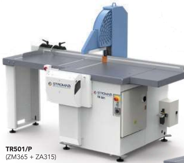
TR501/P (ZM365 + ZA315)