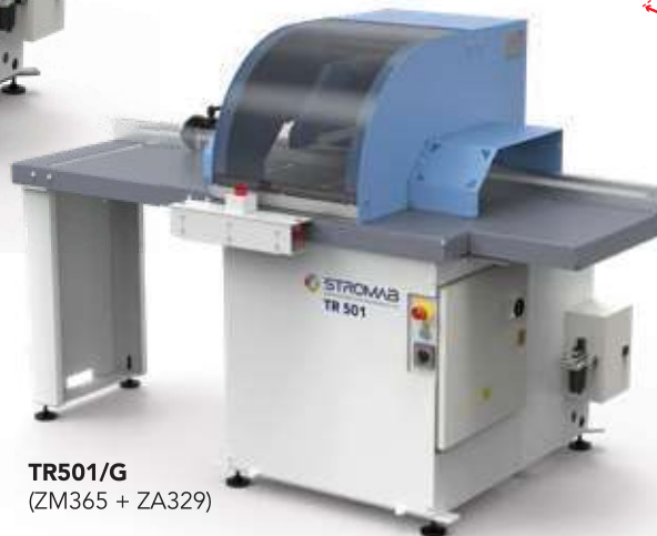
TR501/G (ZM365 + ZA329)